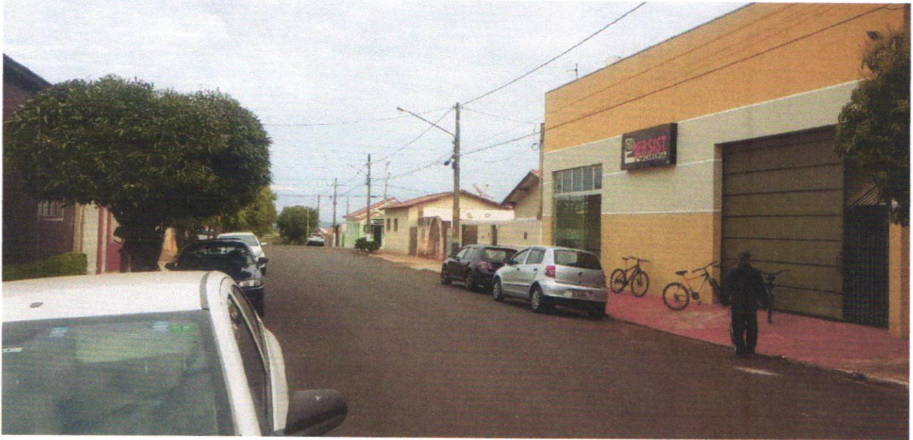
Rua Marcondes Salgado