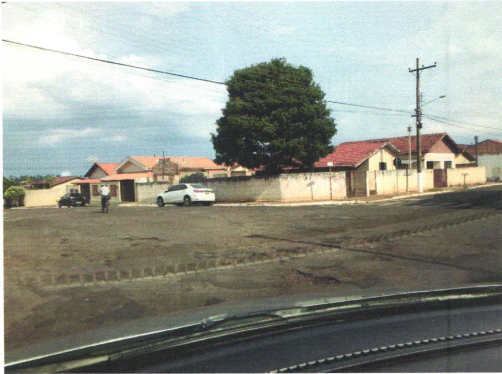
Rua dos Cravos