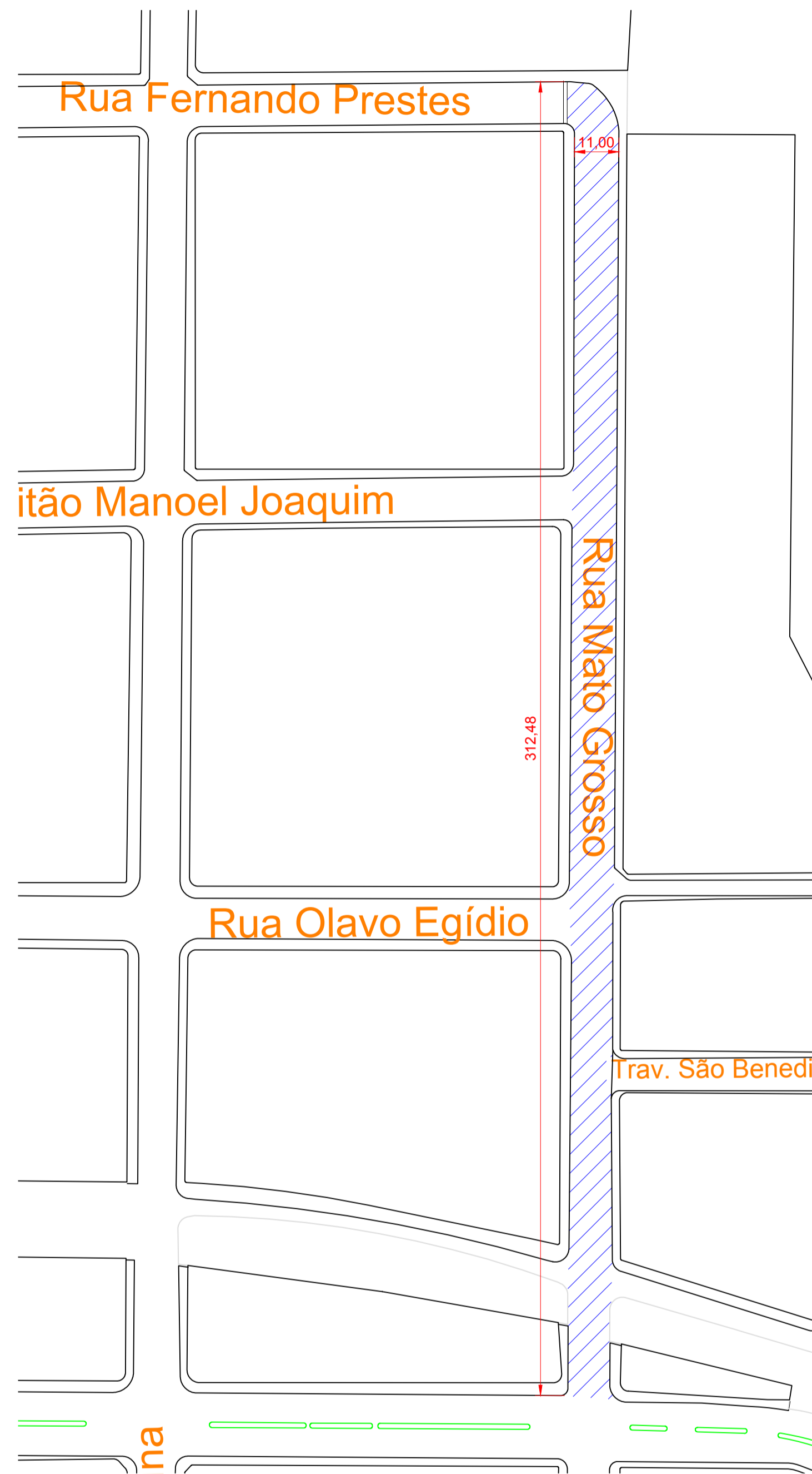
RUA MATO GROSSO (TRECHO) Esc.: 1:1000