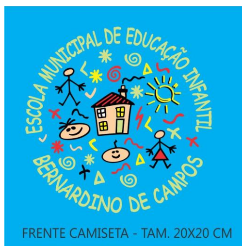
FRENTE CAMISETA - TAM. 20X20 CM