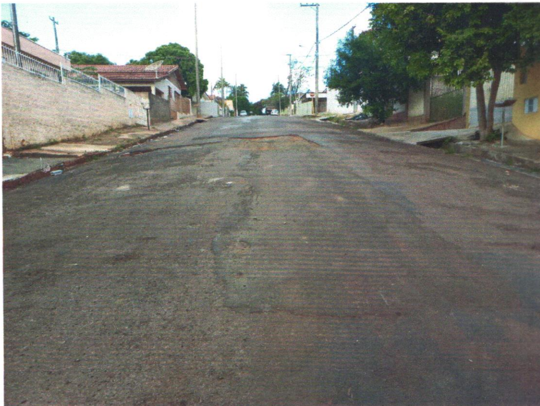
Rua Paulo Moreira 2