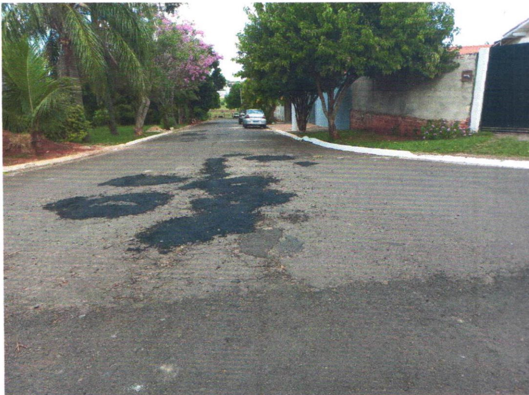
Rua das Orquídeas