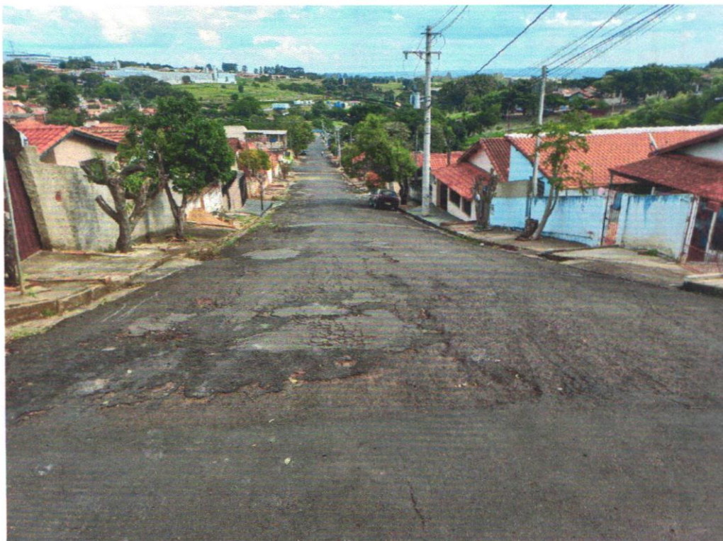
Rua Antônio Prado