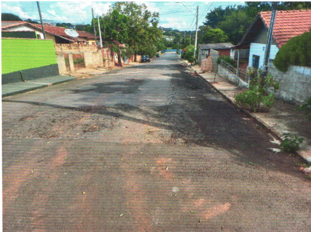
Rua Antônio Prado