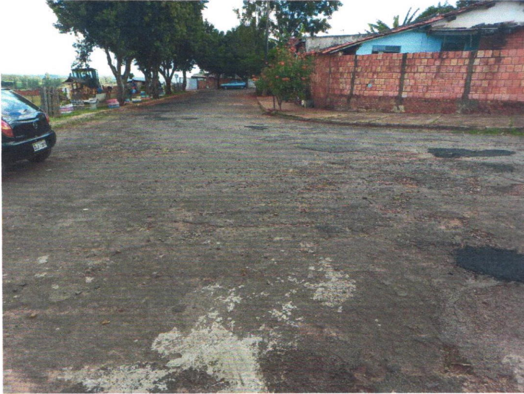
Rua das Orquídeas