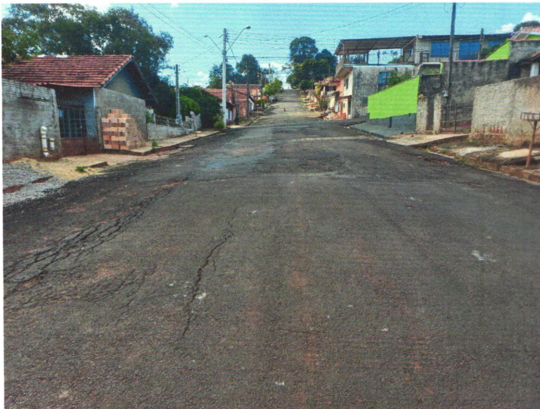
Rua Floriano Peixoto até a metade da rua.