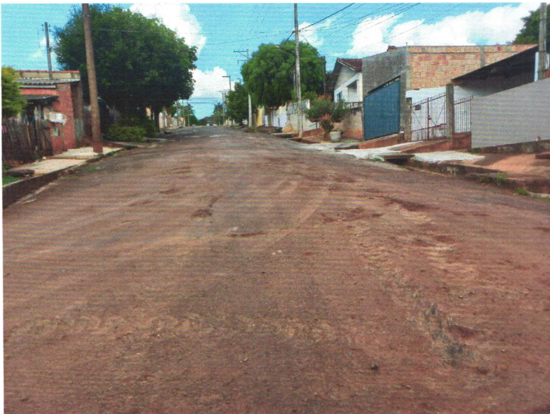
Rua Paulo Moreira 2