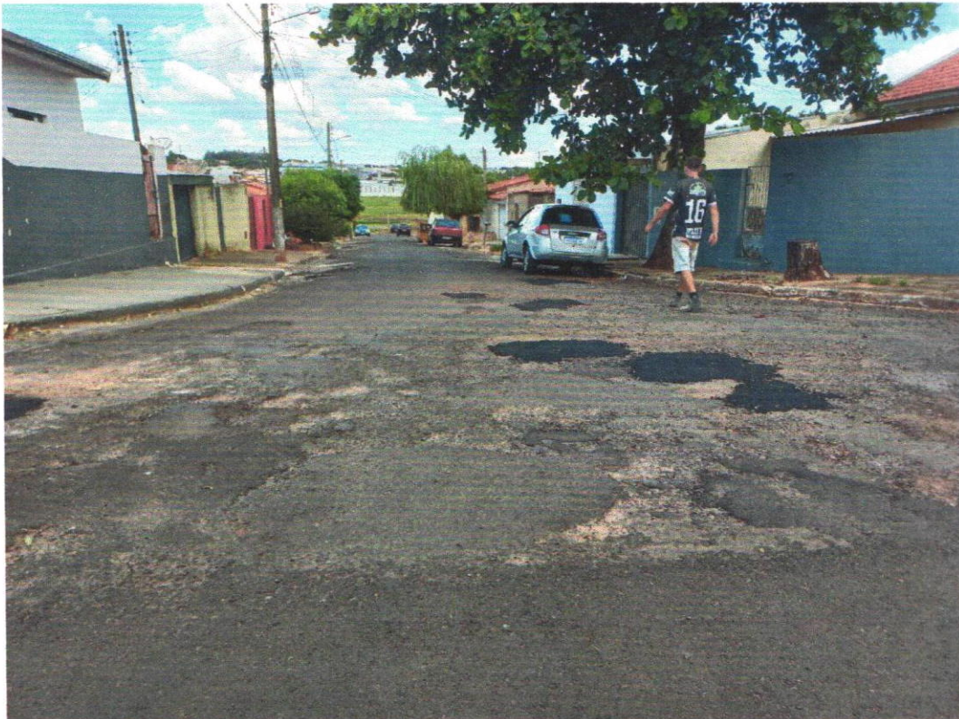
Rua das Orquídeas