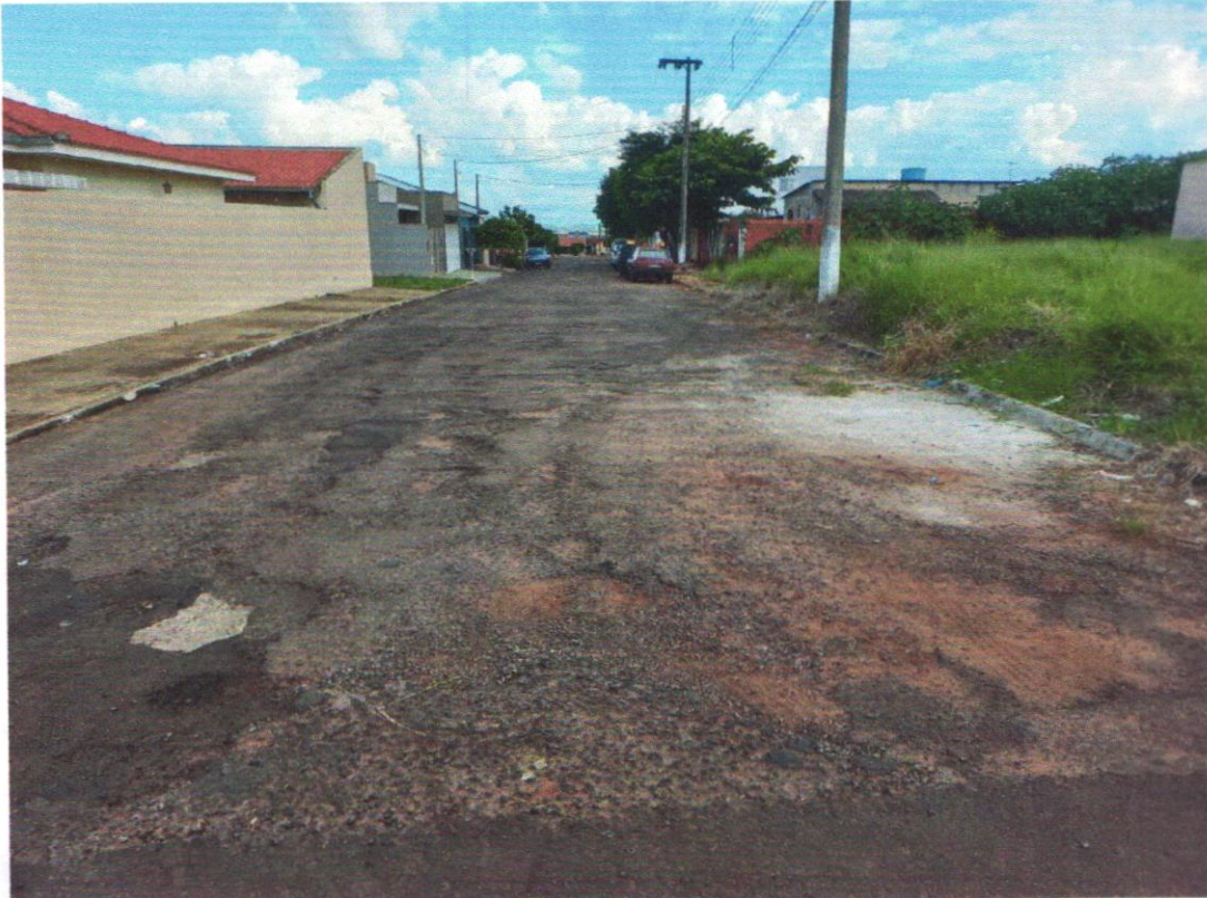
Rua Edson Porto