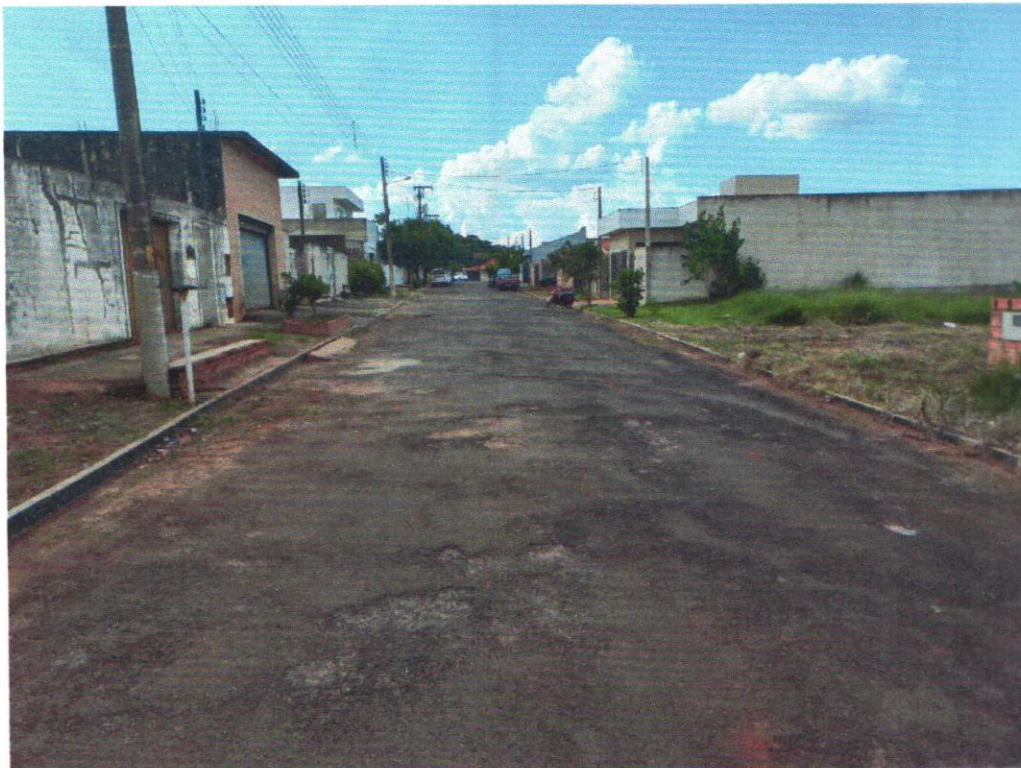
Rua Edson Porto