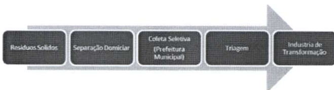
Figura 2 – Fluxograma dos materiais recicláveis