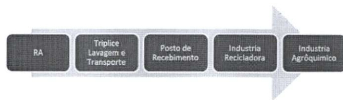
Figura 3. Fluxograma dos Resíduos Agrossilvopastoris

- Embalagens não-laváveis: São todas as embalagens flexíveis e aquelas embalagens rígidas que não utilizam água como veículo de pulverização. Incluem-se nesta definição as embalagens secundárias não contaminadas rígidas ou flexíveis (armazenados em sacos plásticos padronizados).