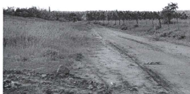
Foto 3: Nova área em fase de licenciamento – área a direita da foto.