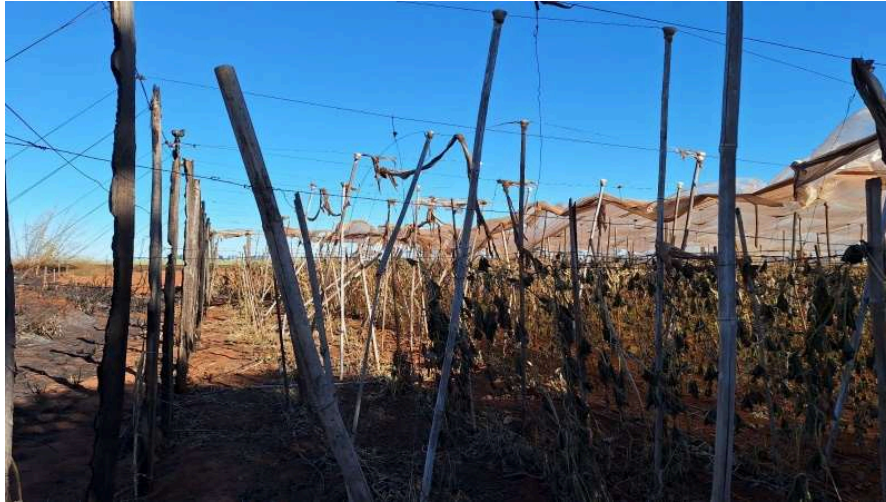
Fotos: Estufa continha plantaço de abobrinha