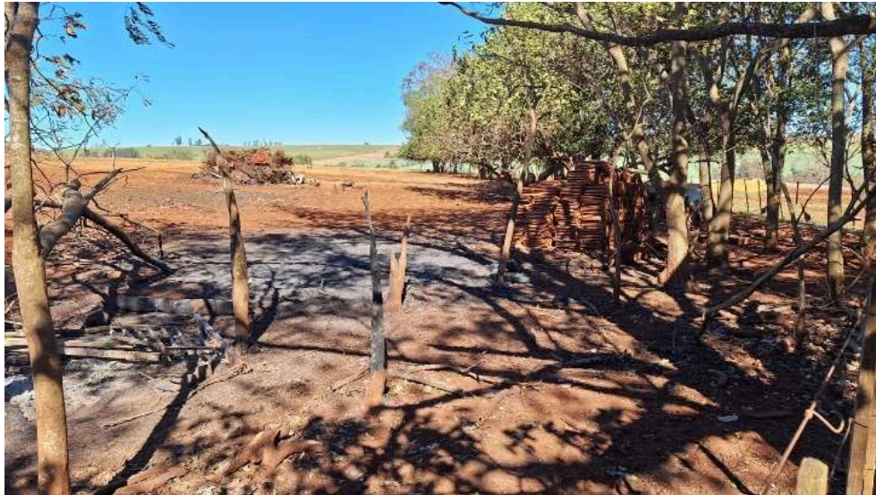
Fotos: Cinzas que restaram

Valor Estimado para restabelecimento: R$ 10.000,00