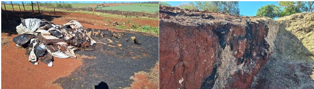
Fotos: Silagem Danificada

Valor Estimado para restabelecimento: R$ 30.000,00