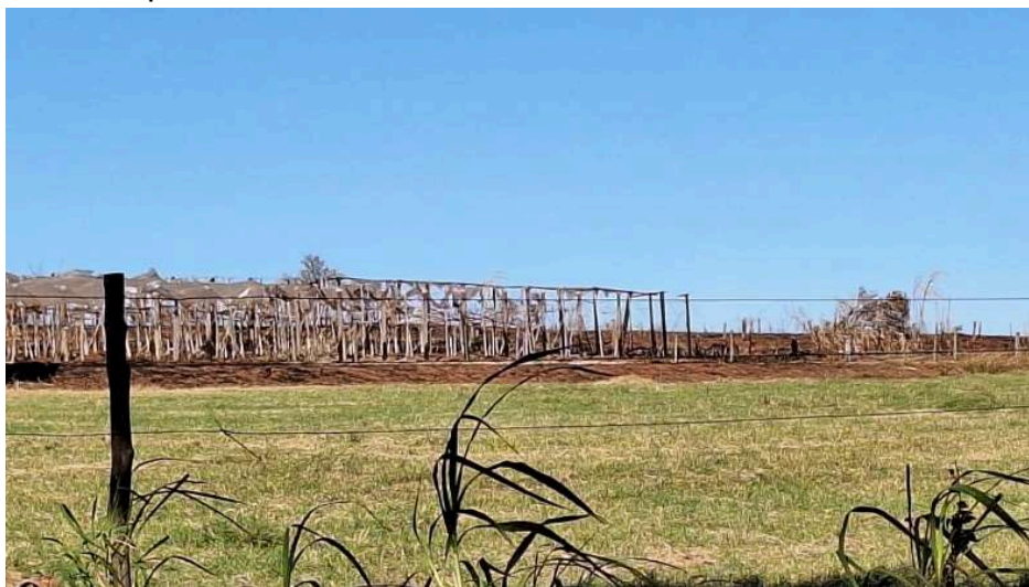
Fotos: Estufa Queimada

Valor Estimado para restabelecimento: R$ 40.000,00