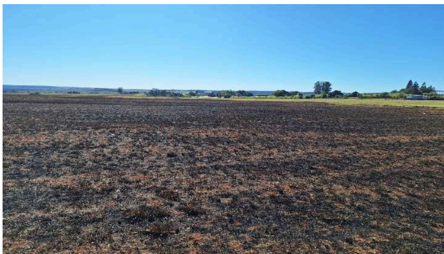
Fotos: Feno Queimado

Valor Estimado para restabelecimento: (R$ 30.000,00)