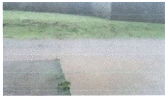
Creche Escola Antônio Carlos Ferraz de Andrade