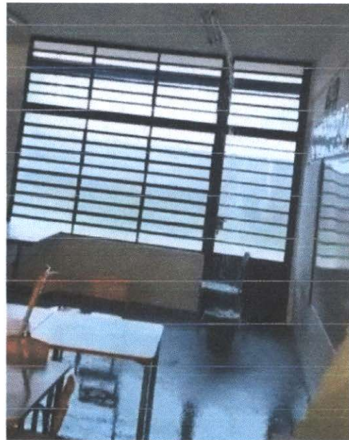
Creche Escola Antônio Carlos Ferraz de Andrade