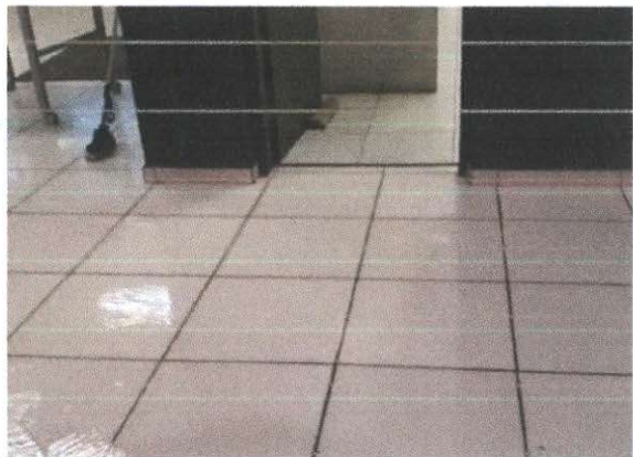
Creche Escola Antônio Carlos Ferraz de Andrade