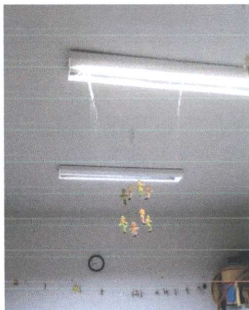
NEI Jardim Brasil