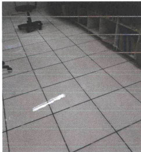
USF Barra Funda