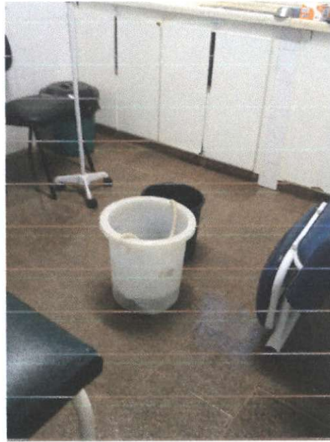
USF Jardim Brasil