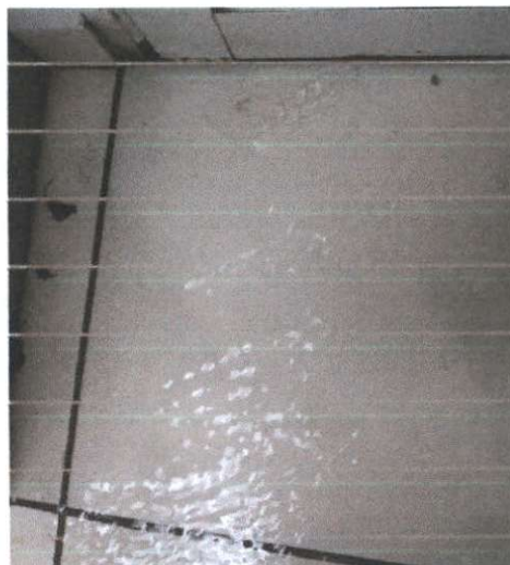
USF Barra Funda