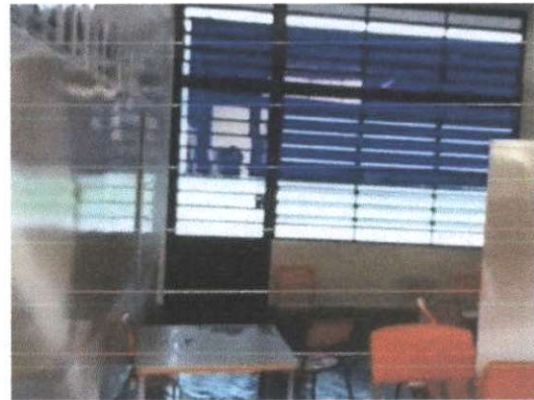
Creche Escola Antônio Carlos Ferraz de Andrade